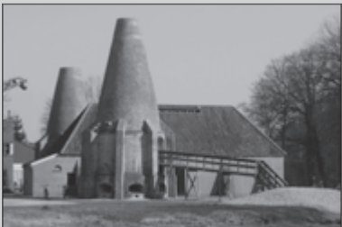
Het Monnikenspoor 20-22