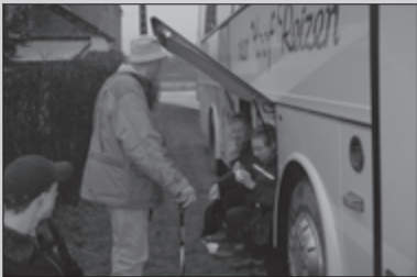
Clubreis Houyet-Leignon 24-25