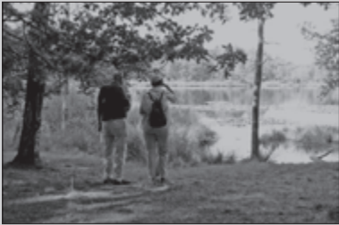
Vooruitblik Avond4daagse 9

CLUBBLAD VAN WSV OLAT • JAARGANG 33 • NUMMER 5 • MEI 2007