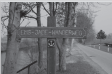
Het Europese Kustpad 26-29

Eindelijk mooi weer tijdens de Paastocht vanuit Asten